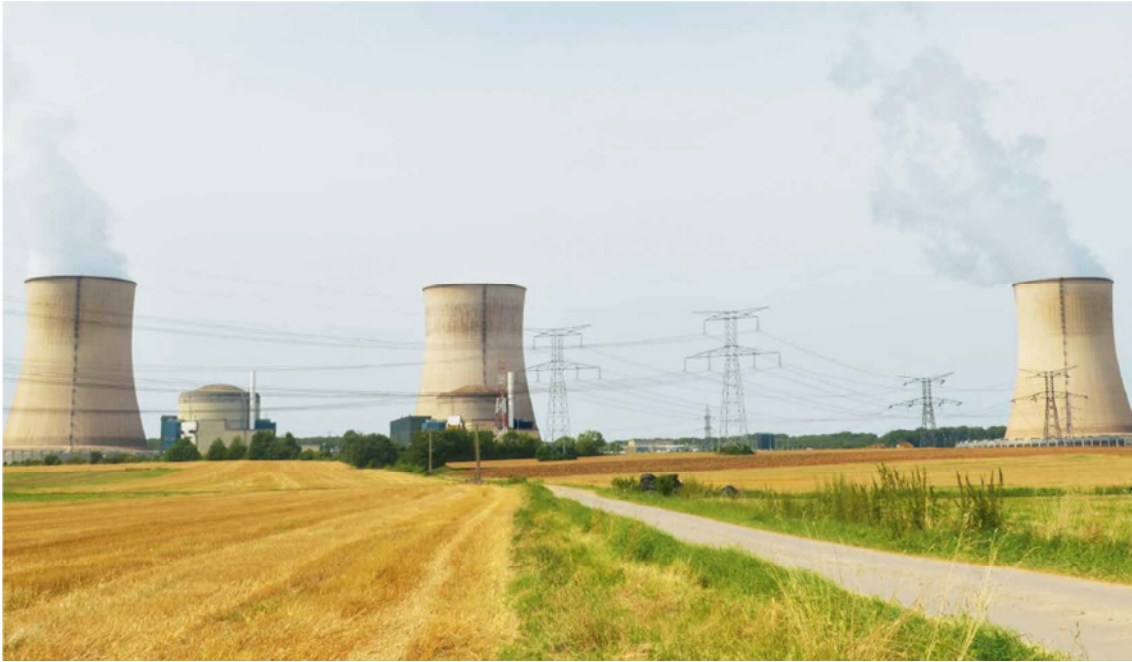
Gilt als eines von Europas störanfälligsten Atomkraftwerken: das französische AKW Cattenom.